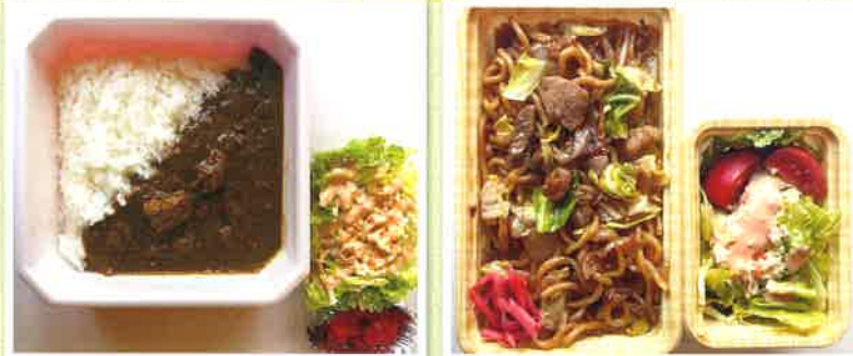
特製カレー(サラダ付き) ¥800(税込)