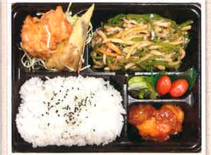
日替わり弁当 ¥800(税込)

予約受付 9:30 ~ 22:00 予約締切 弁当: 当日10時までに(できれば前日) 麺類: 当日 宅配可(+50円、10個~承ります) 他メニュー 日替わり弁当 ¥1000 豚骨醤油ラーメン ¥780 汁なし麺 ¥850 台湾まぜそば ¥880 支払い 現金