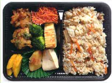
味付けご飯弁当 ¥600(税込)