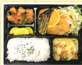
多国籍弁当(ネパール、ブータン、ベトナム) 各国 ¥600, ¥800, ¥1000(各税込)あり。 内容は日替わりとなります。