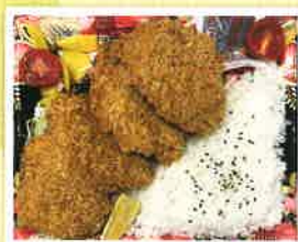
ヒレカツ弁当 ¥800(税込)