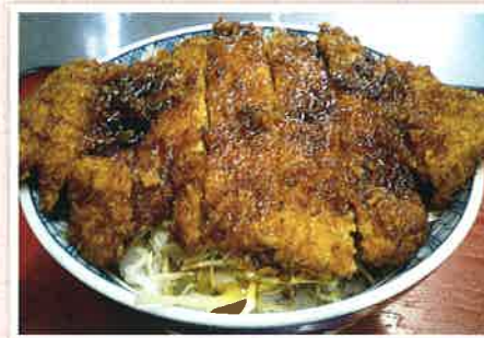
ソースカツ丼 ¥940(税込)

予約受付 8:30 ~ 10:30 予約締切 当日 10:30 まで 他メニュー 丼物(¥830~) 定食弁当(¥1000~) 店舗へ問い合わせください。 支払い 現金 / クレジット / PayPay