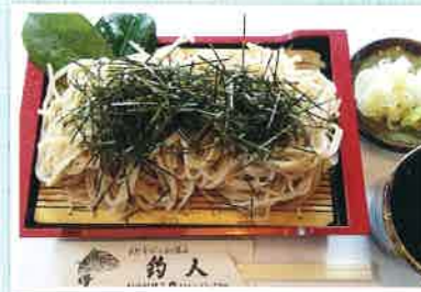
湯かいてお召し上がりください 生そば(つゆ付き) 1人前 ¥500(税込)

予約受付 11:30 ~ 14:30 / 17:00 ~ 21:00 予約締切 できれば前日までに 他メニュー 日替わり おつまみ、おかずセット ¥1,100 ~ 刺身、揚げ物系 詳細は店舗にお問合せください。 (10個以上は事前連絡ください) 支払い 現金 / クレジット / PayPay