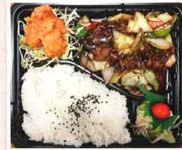
日替わり弁当 ¥600(税込)