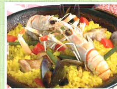
パエリア(2人前~) 1人前 ¥1,700(税込)