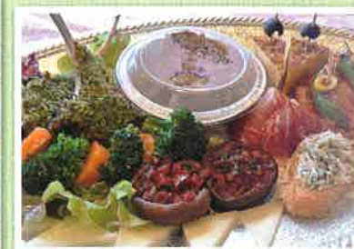
オードブル(イメージ) ¥3,000(税込)~ 人数、予算に応じてお作りします。

予約受付 10:00 ~ 20:00 受け渡し 11:30 ~ 19:00 予約締切 前日までに 支払い 現金 / PayPay 他メニュー ・ガーリック・チキン(ライス付き) ¥1,350 ・イカ墨リゾット ¥1,300(1人分) ・ランチ・パック(3種類) ¥1,000 小エビのアヒージョ 他2種 (パン、スペインオムレツ、人参サラダ付き)