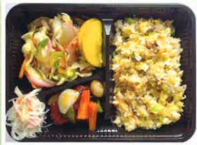
角煮入りチャーハン弁当 ¥600(税込)

予約受付 月・水・金曜日(夕方が連絡つきやすいです。) 予約締切 当日9時まで 他メニュー 唐揚げ弁当 ¥600、おつまみチャーシュー(前日予約のみ) お弁当の内容は変わることがございます。 店舗にお問合せください。 支払い 現金