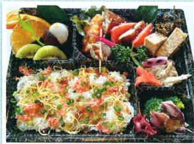
お弁当(イメージ) ¥1,100(税込)

予約受付 11:30 ~ 14:30 / 17:00 ~ 21:00 予約締切 できれば前日までに 他メニュー 日替わり おつまみ、おかずセット ¥1,100 ~ 刺身、揚げ物系 詳細は店舗にお問合せください。 (10個以上は事前連絡ください) 支払い 現金 / クレジット / PayPay